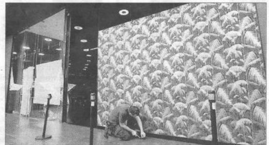
Un operario da los últimos retoques al nuevo espacio.

Chef" está abierto a cualquier iniciativa del sector. El local albergaba un restaurante y ahora la gestión la llevará directamente el centro comercial. Es la primera aproximación del Consorcio Zona Franca al mundo culinario mientras avanza en su proyecto de poner en marcha un centro de excelencia gastronómica.