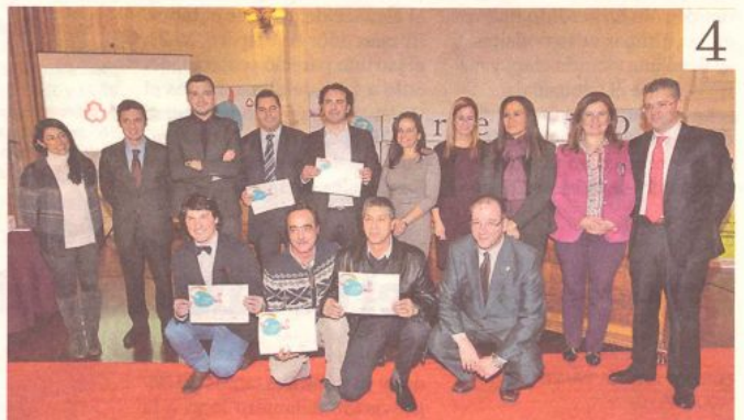
Los premios a los jóvenes empresarios se entregaron en el Mercantil. XÓAN CARLOS GIL