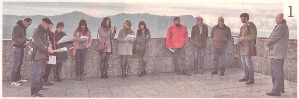
El acto en homenaje a Celso Emilio Ferreiro se celebró en la terraza de la Biblioteca Central de la Universidad de Vigo.