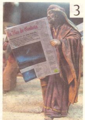
La Voz ya estaba allí para contarlo.