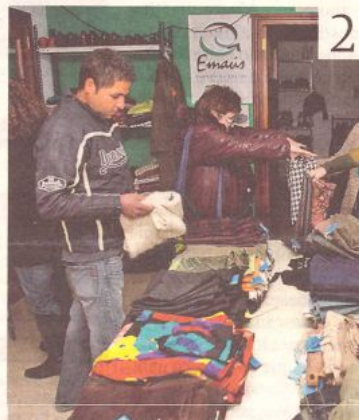
El rastrillo de Emaús está hasta mañana. M.M.

4 Ecologicars Electromovil , dedicada a la importación y montaje de coches eléctricos y transporte ecológico, se alzó con el premio Joven Empresario del Año. El premio Joven Emprendedor fue para Lámparas de Cartón .